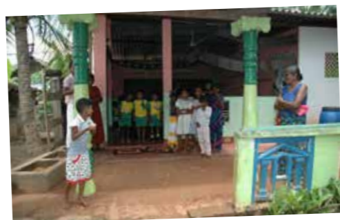
Het schooltje in Kandula

Graag zou ik in elke branche zo'n schooltje beginnen. Het is de brug om de gemeenschap er om heen te bereiken met het evangelie. Wij danken God elke dag voor het werk en het bestuur van de st. Sharety.